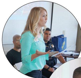
◀제이미 공원 프로그램 담당