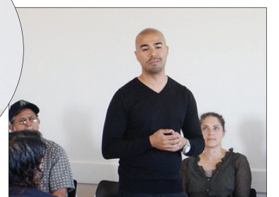
▲비스말크 블랑코 인터뷰 담당