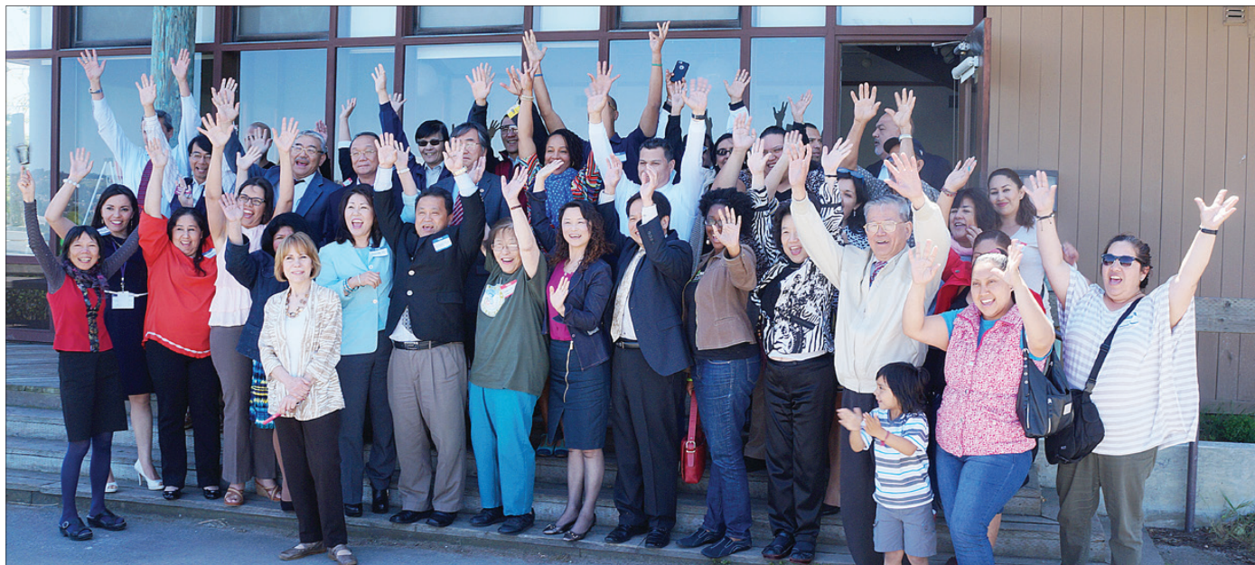
▲참석자 전원이 라운드 테이블 행사 직 후 기념사진 촬영을 하고 있다.